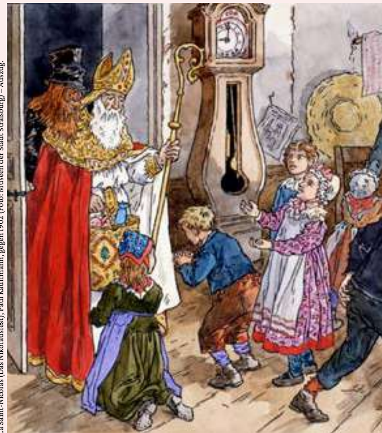
La Saint-Nicolas (Das Nikolausfest), Paul Kauffmann, gegen 1902. – Auszug.

❶ So., 22. Dezember um 16:30 Uhr. Dauer: 1 Stunde. Preise: Normaltarif: 6,50 € und Ermäßigt: 3,50 €.